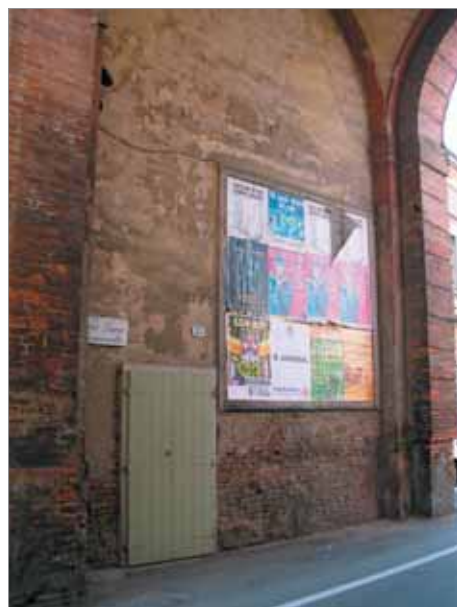
corso mazzini 55